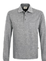
015 grau meliert